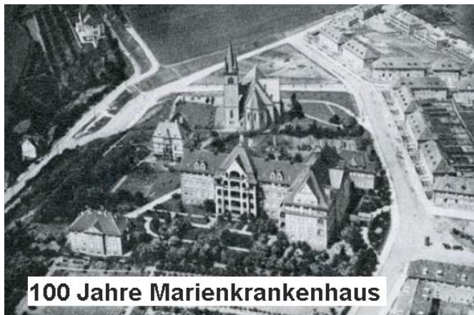
100 Jahre Marienkrankenhaus